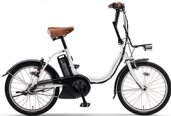
電動アシスト自転車 (YAMAHA PAS CITY-C)